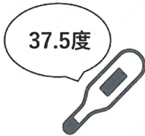
37.5度以上の発熱 (4日以上続く)