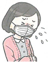
風邪の症状 (4日以上続く)